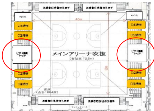
Y-mitアリーナ2か所 (6月24日/25日)