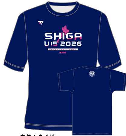
本体：ネイビー カラー：ホワイト / ショッキングピンク