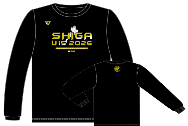
本体：ブラック カラー：金ラメ / ホワイト