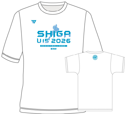
本体：ホワイト カラー：ブルーグリーン / ライトブルー