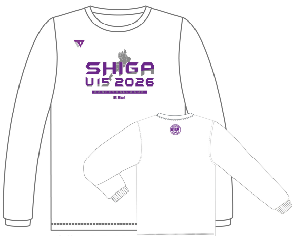
本体：ホワイト カラー：パープル / 銀ラメ