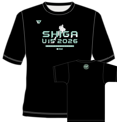
本体：ブラック カラー：ミント / ホワイト